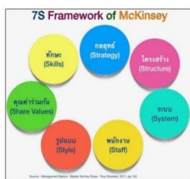
แผนภาพที่ 2 กรอบการวิเคราะห์ของ McKinsey 7s Model

1. การวิเคราะห์สภาพแวดล้อมภายใน ซึ่งประกอบด้วย จุดแข็ง (Strength) และจุดอ่อน (Weakness) โดยได้ใช้กรอบการวิเคราะห์ของ McKinsey 7s Model รายละเอียดตามแผนภาพที่ 2